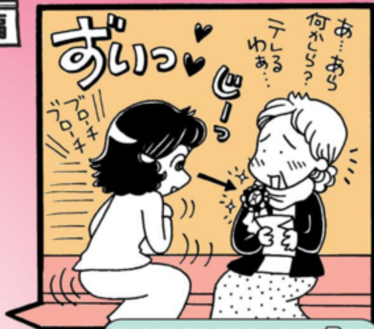
気になると思わず近づいてしまうBさん

お気付きのことは下記までお問い合わせください。 ・中区障害者支援拠点 「みはらしポンテ」 TEL 045-628-1343 ・中区役所 高齢・障害支援課 TEL 045-224-8165