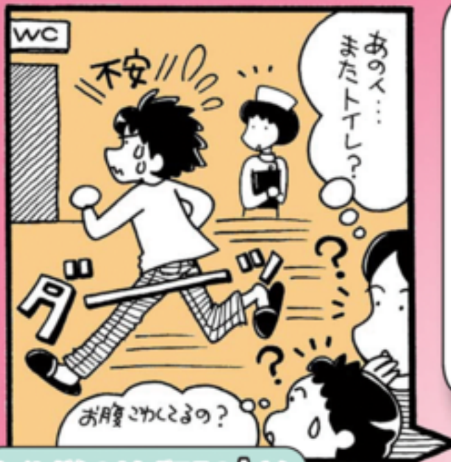
トイレが心のよりどころのAさん