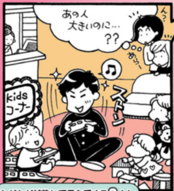
ただただ純粋に玩具を愛するCくん

知的障害、発達障害のある人はその独特の行動で誤解を招くことがあります。でも悪気からではなく、その人なりの理由があるので、ご理解のほど、よろしくお願いいたします。